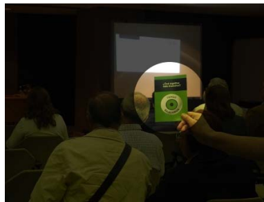
Visión con Retinosis Pigmentaria.