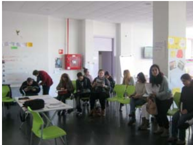
Cursos de formación en BV.

De la misma forma se necesitan entornos formativos y de relación con personas con baja visión.