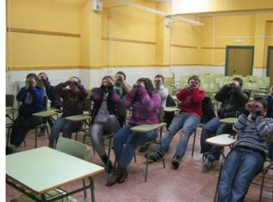
Actividades de sensibilización con jóvenes