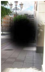
Visión con DMAE.