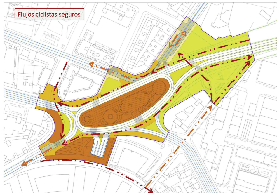
Esquema de movilidad ciclable

5.6.- Movilidad en bicicleta. Actualmente ni General Elorza, ni la vía de penetración ni los barrios del Milán, Pumarín, Teatinos, Ventanielles, o la Tenderina, integran la bicicleta como alternativa de movilidad. La glorieta en su configuración actual funciona como barrera urbana que mediatiza el acceso desde estos barrios al centro de la ciudad en modos de movilidad alternativa segura. La reconfiguración del conjunto de la vía de penetración, como gran corredor urbano, supone la oportunidad de integrar otras formas de movilidad con itinerarios prioritarios, parte de los cuales deben discurrir por este entorno para conectar con el centro de la ciudad