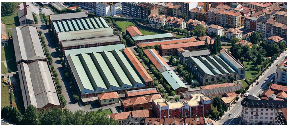
Estrategia de Desarrollo Urbano Sostenible (EDUSI) R5.

Nuestra actuación, el “El mirador de Santullano”, constituye una pieza muy importante por su emplazamiento estratégico como punto, no solo de nexo con la trama del casco y barrios del entorno, sino también como punto origen y de partida para las futuras actuaciones del Bulevar de Santullano y de la Fábrica de la Vega como lugar neurálgico de centralidad y accesibilidad cohesionando los barrios de la ciudad, calmando el tráfico rodado que actualmente existe y potenciando nuevos modos de movilidad; a la vez que punto de potencial de desarrollo económico y cohesión social.