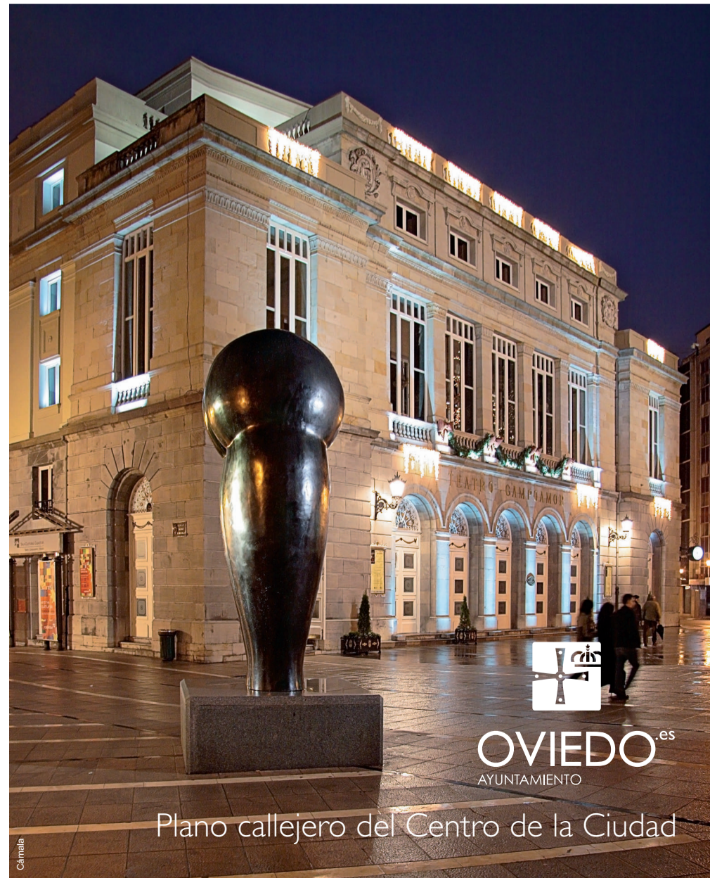
Plano callejero del Centro de la Ciudad

Ayuntamiento de Oviedo Tf: 985 98 18 00 Principado de Asturias Tf: 985 10 55 00