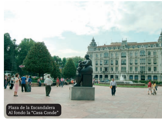
Plaza de la Escandalería Al fondo la "Casa Conde"

Desde la plaza de la Escandalería se conecta con el centro más comercial de la ciudad, formado por el eje de la calle Uría, su paralela, Pelayo y las calles Palacio Valdés, Doctor Casal, Caveda y Nueve de Mayo, entre otras. Esta zona, auténtico ensanche de la ciudad, ha ido acumulando negocios: librerías, joyerías, pastelerías, restaurantes, zapaterías y numerosas tiendas de moda que configuran el espíritu comercial de la ciudad. Entrar a conocer y probar las mercancías expuestas se convierte en todo un placer.