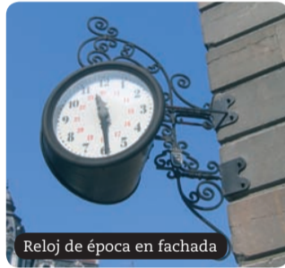
Reloj de época en fachada