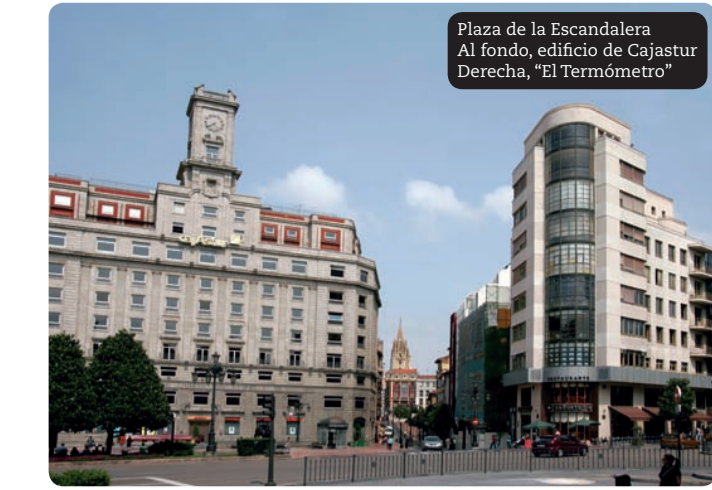
Plaza de la Escandalería Al fondo, edificio de Cajastur Derecha, "El Termómetro"

La calle Argüelles, que surge desde la plaza de la Escandalería hacia el Este, es también una vía con muestras arquitectónicas de valor, destacando especialmente el edificio del antiguo Instituto Nacional de Previsión, hoy sede de la administración sanitaria de Asturias, que se levanta ante la plaza del Carbayón. Insigne ejemplo de la modernidad, es obra de Vaquero Palacios. Ante este edificio, se encuentra el conjunto escultórico de Esperanza D'Ors, "Homenaje a la Concordia".