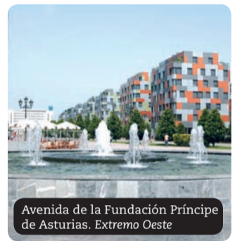
Avenida de la Fundación Príncipe de Asturias. Extremo Oeste

Este espacio se prolonga hacia un moderno hotel que cierra la plataforma y que también se remata con una fuente circular.