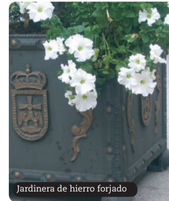
Jardinería de hierro forjado

Fuera de los límites estrictos del centro comercial de Oviedo hay una ciudad que palpita con igual intensidad y también con numerosos comercios susceptibles de ser visitados. La calle Valentín Masip que termina en el inmenso Parque del Oeste, el paseo de La Florida considerada la calle más larga de la ciudad o, en el lado opuesto, la zona del Campus de Humanidades, son ejemplos de un Oviedo actual, con edificaciones enclavadas en urbanizaciones amplias y modernas y llenas de vida.