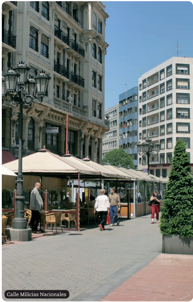
Calle Milicias Nacionales