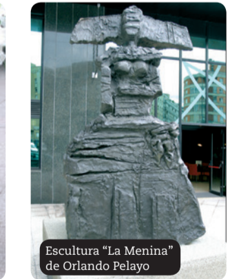
Escultura "La Menina" de Orlando Pelayo