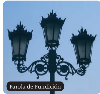
Farola de Fundición

central de la ciudad, y donde se encuentran las tiendas de moda de primeras marcas a nivel mundial. Junto con la vecina Gil de Jaz, las firmas de los diseñadores más cotizados tienen su lugar preferente en el núcleo comercial ovetense. En este espacio se yerguen edificios de extraordinaria arquitectura entre las que destaca las denominadas "Casas del Cuito", en los números 27-29 de la calle Uría, levantado entre 1913 y 1917, muestra exteriormente el eclecticismo de la época junto a un barroquismo agotado, cuentan con gran variedad de detalles ornamentales.