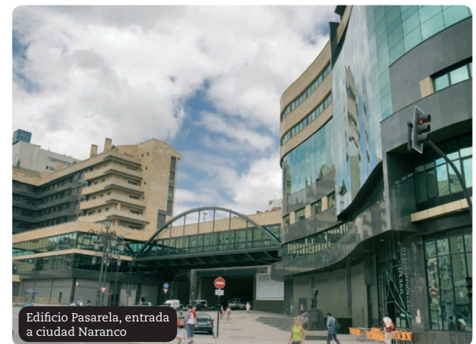
Edificio Pasarela, entrada a ciudad Naranco