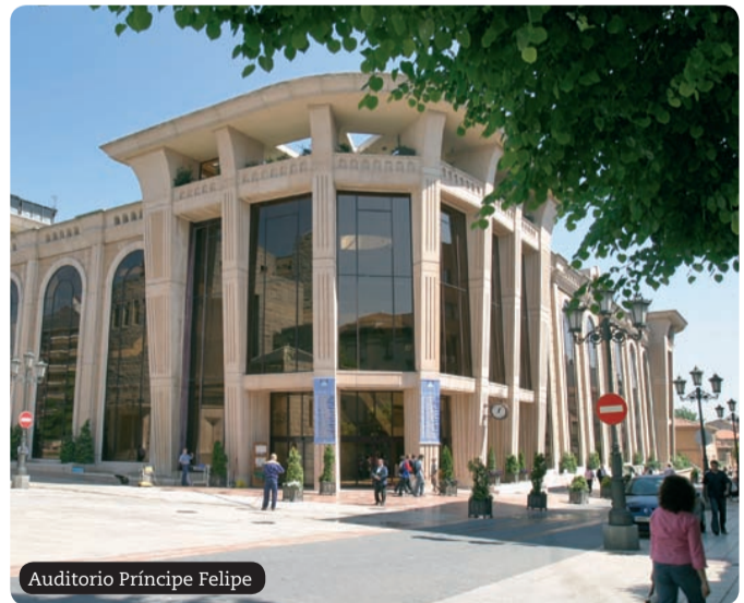
Auditorio Príncipe Felipe

A su lado encontramos el edificio de Hidrocarburo, obra de Joaquín Vaquero Palacios. Este inmueble, de gran valor arquitectónico, es uno de los mejores ejemplos del llamado estilo internacional.