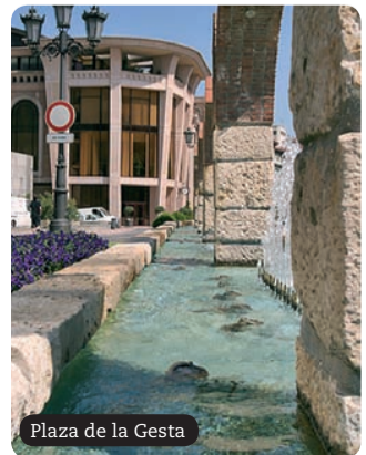
Plaza de la Gesta