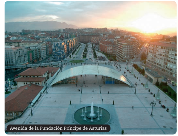
Avenida de la Fundación Príncipe de Asturias

En la plaza de los Ferrovianos, el nuevo espacio abierto sobre la estación propiamente dicha, se encuentra la escultura "Hombre sobre Delfín", de Salvador Dalí. Se trata de una copia autorizada de la obra que modeló el genio de Figueras con sus propias manos.