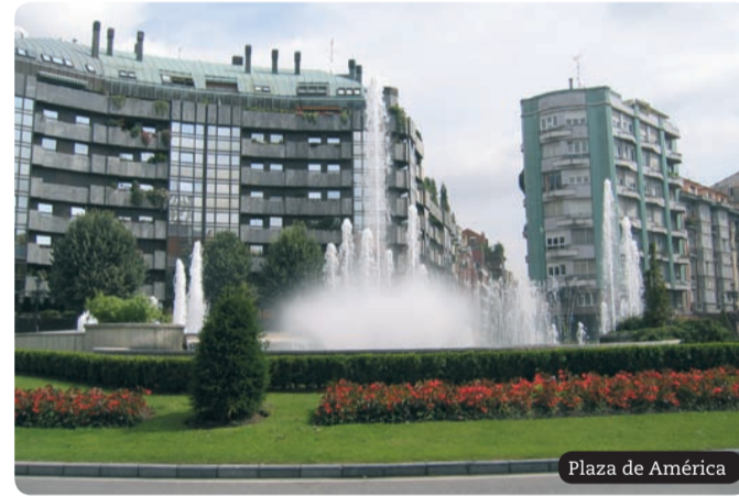
Plaza de América

En la plaza de la Escandalería se levanta el singular edificio conocido como la "Casa Conde", diseñado por Juan Miguel de la Guardia en 1904. En este espacio se encuentra también la sede central de Cajastur, proyectada en el año 1946, y concluida en 1965, cuyo reloj marca las horas en Oviedo repicando con el sonido del "Asturias Patria Querida" (himno de Asturias). Cierra esta plaza otro edificio representativo, denominado "El Termómetro" situado en la confluencia con la calle Fruela, que es obra de Saiz Heres y que recibe su popular nombre por su verticalidad y las cristalerías curvas que atenúan su esquina. Frente a este edificio se encuentra el de la Junta General del Principado de Asturias, el Parlamento Autonómico, obra del arquitecto García Rivero, que data de 1904. García Rivero aplicó los recursos del eclecticismo clásico. Resulta un edificio robusto del que destacan, en su interior, su monumental escalinata central y los salones realizados con ricos materiales. En la calle Santa Cruz sobresalen varios edificios de diferentes estilos, incluido el modernista.