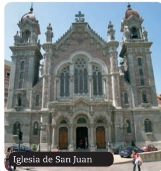
Iglesia de San Juan

Desde esta plaza se puede ascender por la calle Covadonga hasta su confluencia con las calles Palacio Valdés y Melquiades Álvarez, que junto con Doctor Casal constituyen un área comercial en continuo movimiento ciudadano. En esta zona de la ciudad cabe destacar el templo parroquial de San Juan, que fue denominado "la catedral del ensanche" durante su construcción, en el primer tercio del siglo XX. La iglesia se ubica en el inicio de la calle Melquiades Álvarez que mantiene buenos ejemplos de arquitectura expresionista y modernista. Esta calle entronca con Uría, auténtica arteria