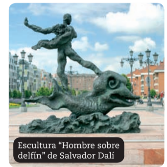
Escultura "Hombre sobre delfín" de Salvador Dalí