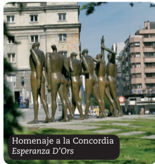
Homenaje a la Concordia Esperanza D'Ors