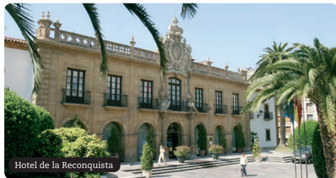
Hotel de la Reconquista