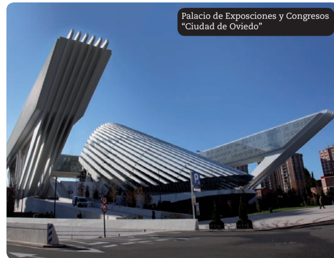
Palacio de Exposiciones y Congresos "Ciudad de Oviedo"

En las proximidades de esta plaza, se encuentra el Palacio de Exposiciones y Congresos "Ciudad de Oviedo", obra del escultor y arquitecto valenciano Santiago Calatrava. Esta singular edificación dota a la ciudad de una imagen única, moderna y vanguardista, combinando servicios hoteleros y comerciales; debido a su situación y sus amplias instalaciones se ha convertido en el centro neurálgico de los congresos nacionales e internacionales que se celebran en Asturias. La edificación está formada por dos módulos, uno exterior que rodea el palacio y se sostiene sobre complejos pórticos de acero creando una forma de U; y otro central y de mayor envergadura en forma de concha donde se sitúan las salas de congresos y un centro comercial parcialmente soterrado. Fue inaugurado en mayo de 2011.