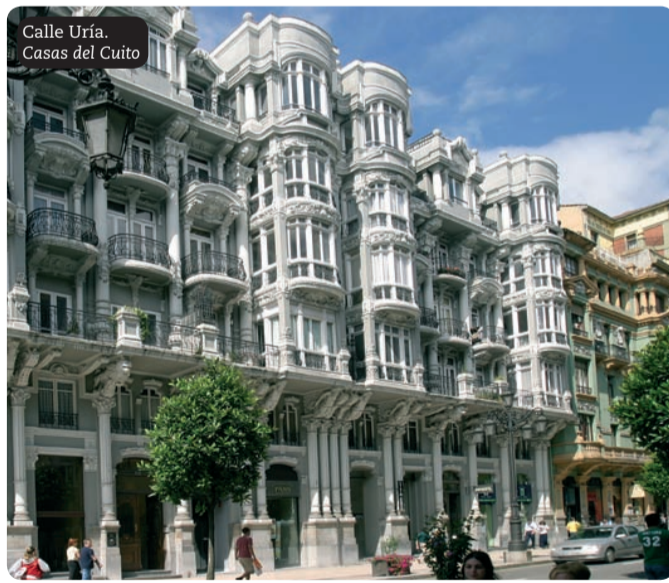
Calle Uría, Casas del Cuito

central de la ciudad, y donde se encuentran las tiendas de moda de primeras marcas a nivel mundial. Junto con la vecina Gil de Jaz, las firmas de los diseñadores más cotizados tienen su lugar preferente en el núcleo comercial ovetense. En este espacio se yerguen edificios de extraordinaria arquitectura entre las que destaca las denominadas "Casas del Cuito", en los números 27-29 de la calle Uría, levantado entre 1913 y 1917, muestra exteriormente el eclecticismo de la época junto a un barroquismo agotado, cuentan con gran variedad de detalles ornamentales.