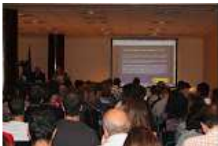
Momento de las Jornadas, en el Auditorio Príncipe Felipe