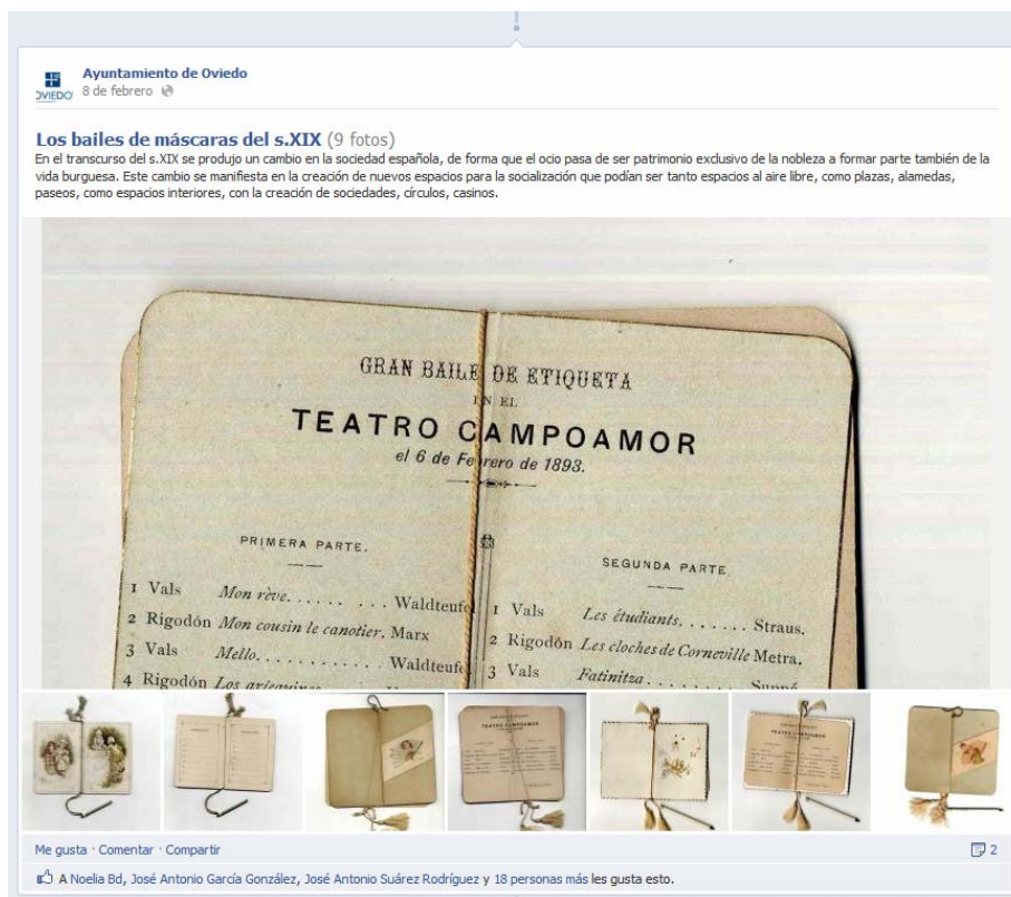
Los Bailes de máscaras del s. XIX Facebook. Febrero, 2013