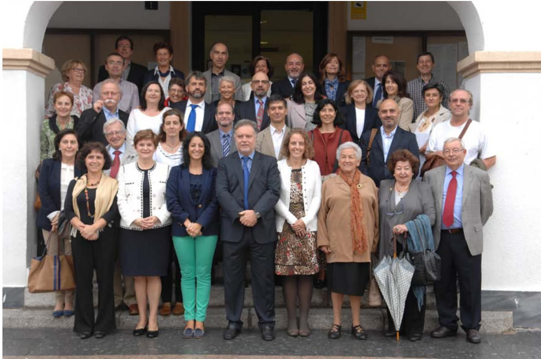
XXXI Mesa Nacional de Archivos de la Administración Local San Sebastián de los Reyes, 4 de octubre de 2013