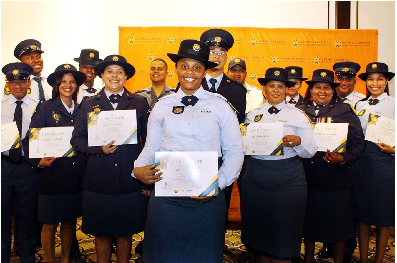
Agentes se gradúan de un curso de policía con perspectiva de género en Sudáfrica el 1 de diciembre de 2023.