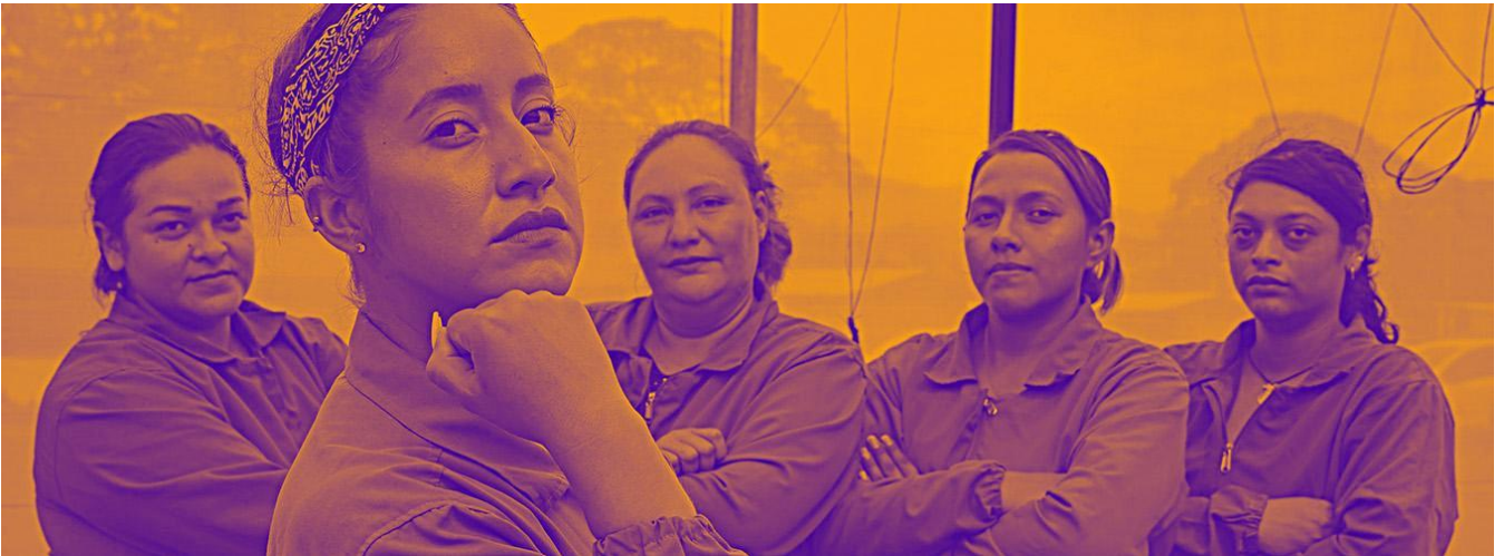
Expertas viveristas y beneficiarias de un proyecto de ONU Mujeres en El Salvador, en donde trabajan en un vivero experimental para que puedan cultivar..

La web oficial de ONU Mujeres es el punto de encuentro digital para movilizar, aportar soluciones, contar historias de superación y encontrar materiales para difundir el mensaje a través de las redes sociales.