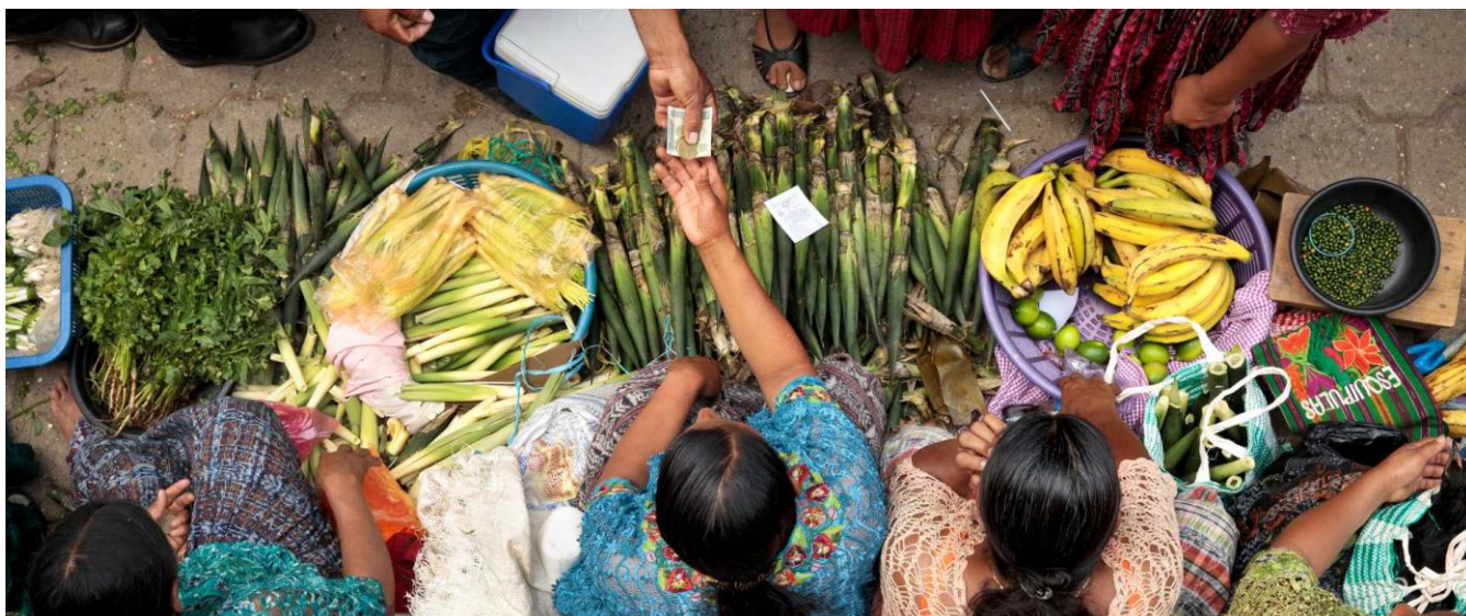
Scenes from the municipal market in Tucuru, Guatemala.

Explore los principales datos y hechos sobre el empoderamiento económico de las mujeres. Desde la desigualdad de ingresos y las tendencias del mercado laboral al emprendimiento y el acceso a los recursos financieros, estas estadísticas ponen de relieve la importancia fundamental del empoderamiento económico para avanzar hacia la igualdad de género e impulsar el desarrollo sostenible.