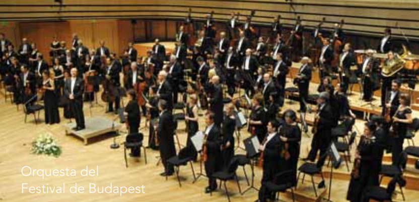
Orquesta del Festival de Budapest