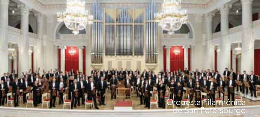
Orquesta Filarmónica de San Petersburgo