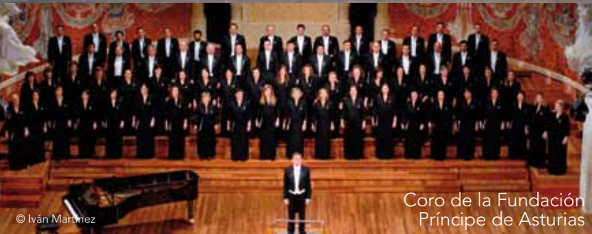
Coro de la Fundación Príncipe de Asturias