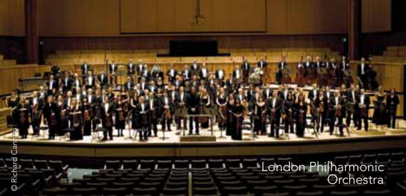
London Philharmonic Orchestra