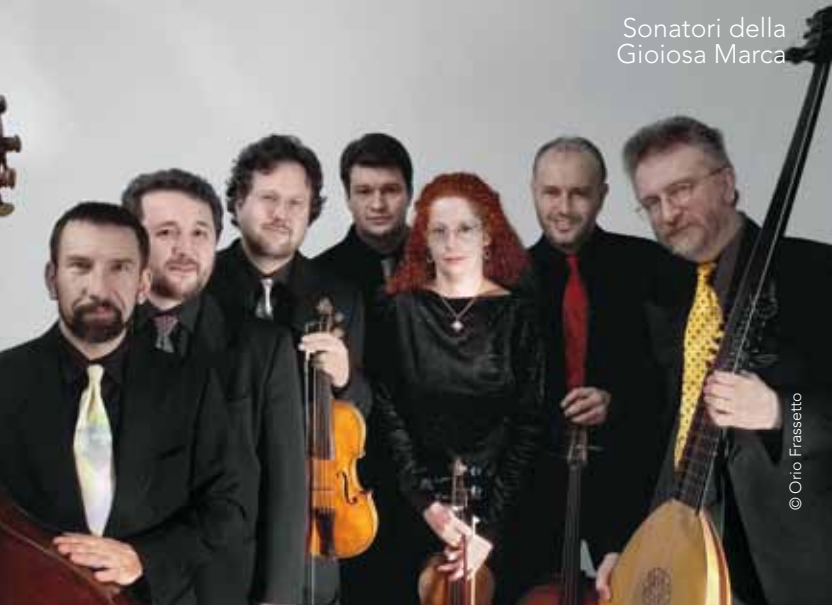
Sonatori della Gioiosa Marca