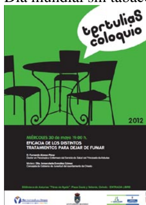
Eficacia de los distintos tratamientos para dejar de fumar