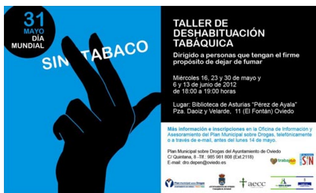
Día mundial sin tabaco