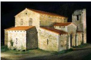
Santa María de Bendones

Iglesia de tipología singular al tener una nave única y cabecera con tres capillas a oriente. Su acceso se realiza por pórtico triple.