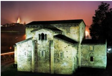
San Julián de los Prados

Construida bajo el reinado de Alfonso II (791-842). La iglesia es alabada por la Crónica de Alfonso III Rotense (año 883) '...por su mucho arte y admirable disposición'.