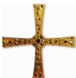
Cruz de Los Ángeles

Extraordinaria pieza de orfebrería realizada bajo el reinado de Alfonso II en el año 808. La Cruz de los Ángeles se convertiría en un símbolo religioso y político de la Monarquía Asturiana, representativo de la unidad de Iglesia y Estado.