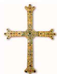
Cruz de la Victoria

Representa la obra más excelsa, realizada por orfebres asturianos y artistas procedentes del reino franco, que el rey Alfonso III mandó hacer como donación a la catedral de San Salvador el 27 de Marzo de 908, conmemoración del día de Pascua.