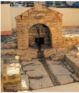
Fuente de Foncalada

Una de las más excepcionales construcciones urbanísticas altomedievales. Conformaba un templete o edículo cuya función era la de albergar el alumbramiento de un manantial de agua que era retenida en un estanque.