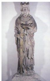
Escultura de Alfonso XI

La Diócesis de Oviedo, acorde con esta línea de pensamiento, proyectó realizar un Museo de Arte Sacro en el Claustro Alto de la Catedral. El marco, obra de Francisco de la Riva Ladrón de Guevara (1729), resultaba excepcionalmente apropiado por su configuración arquitectónica. Las obras de adaptación se llevaron a cabo a partir de 1982, bajo dirección del arquitecto Antonio González-Capitel.