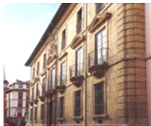
Exterior de Museo de Bellas Artes

El Museo, inaugurado el 19 mayo de 1980 a partir de la colección de arte de la extinta Diputación Provincial, es un organismo autónomo regido y financiado por la Comunidad Autónoma del Principado de Asturias y el Ayuntamiento de Oviedo.