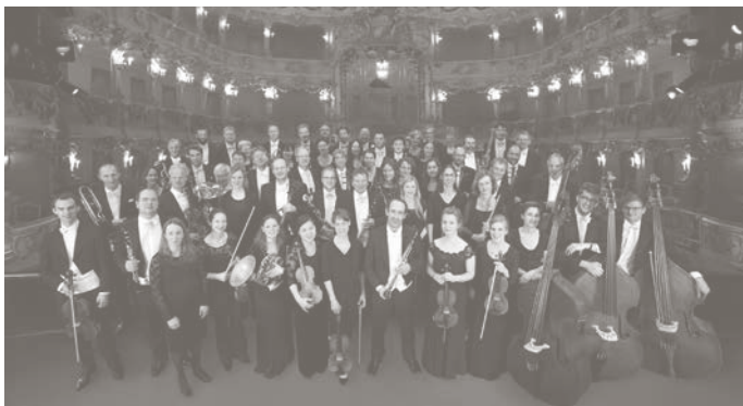
Foto Orquesta del Teatro Estatal de Gärtnerplatz de M